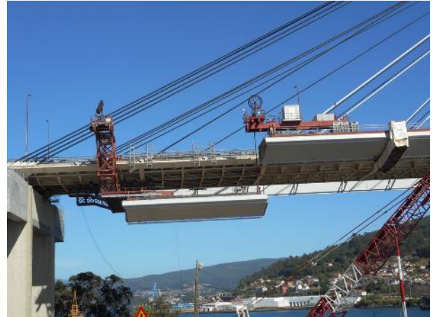
Figura 2.-Carros delantero y trasero.

en el que se comenzaba la soldadura de su extremo trasero a la última dovela soldada con anterioridad. Tras completar un cierto porcentaje de esta soldadura se podía proceder a la soldadura de las rótulas de unión al tablero antiguo.