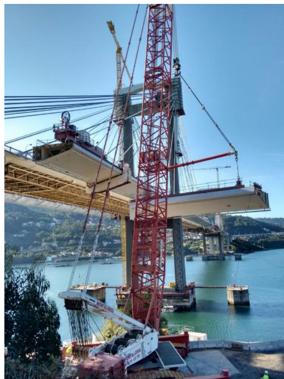
Figura 8.- Izado de dovela lateral lado Norte con grúa

En ambos casos, la conexión de los nuevos péndulos era preceptiva antes de que los correspondientes tirantes pudiesen ser anclados a esas dovelas.