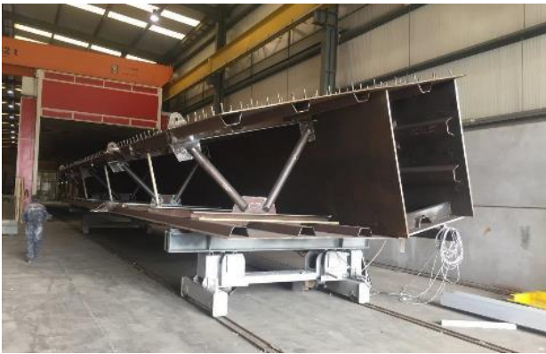
Figura 1.-Dovela 0 en taller.

tablero existente, o bien dividida longitudinalmente en dos mitades. En todos los casos las dovelas, una vez llegadas a la zona de obra acondicionada al efecto, seguían el proceso de completarlas con las celosías y elementos que quedasen pendientes de manera previa a su acopio y preparación para la carga en una pontona.