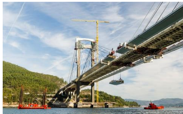
Figura 5.-Izado de dovela de cierre

provisionales que permitían ejecutar la soldadura sin introducir tensiones parásitas.