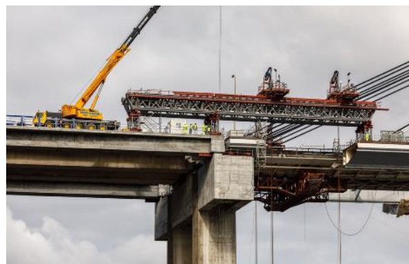
Figura 6.- Detalle de estructura de izado de dovela lateral lado Sur

Las últimas dovelas de los vanos laterales son las encargadas de acomodar los tirantes correspondientes a la parte no simétrica del vano central, así como de materializar la conexión a las pilas estribo. El montaje de estas dovelas fue diferente según el lado del puente al que nos referimos.