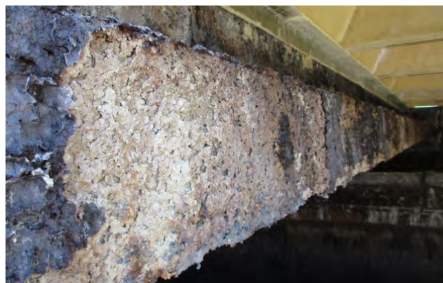
Figura 4. Degradación por ataque ácido tras reparación y protección superficial.

El fuerte deterioro que produce este agente se debe a la reacción del ácido en contacto con la superficie básica del hormigón, que ocasiona procesos de disolución de todas las fases cálcicas de la pasta de cemento hidratado (figura 4).