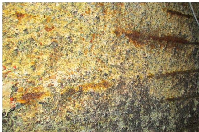
Figura 3. Degradación severa por ataque ácido con intensa corrosión de armaduras.

Respecto al espesor de hormigón afectado, la degradación por la acción del ácido sulfúrico ocasiona una acusada pérdida de material en la capa más superficial del hormigón, llegando en muchos casos a degradar por completo el espesor de recubrimiento íntegro y producir una acusada corrosión de las armaduras, con importantes pérdidas de sección del acero (figura 3).