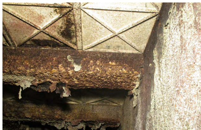
Figura 5. Degradación por ataque ácido en pozo.

Los daños son muy severos en los paramentos de algunas galerías así como en el pozo de compensación y retorno, principalmente en las bóvedas y en las zonas por encima del nivel habitual del agua (figura 5).