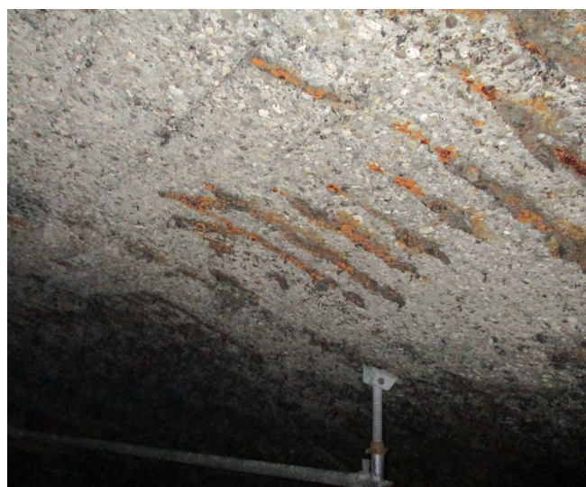
Figura 1. Ataque ácido en bóveda de digestor.

En la mayor parte de las inspecciones ha resultado evidente que el severo deterioro superficial observado en los paramentos emergidos de algunos de los elementos del hormigón originalmente ejecutados, así como de los morteros de reparación eventualmente aplicados, es compatible con la degradación producida por un ataque ácido de estos materiales fabricados con cemento portland. El agente agresivo causante del deterioro es el ácido generado por procesos metabólicos bacterianos producidos durante el tratamiento biológico de las aguas residuales. En la figura 1 se presenta el aspecto de una bóveda del digestor de una estación depuradora de aguas residuales (EDAR) con este tipo de deterioro.