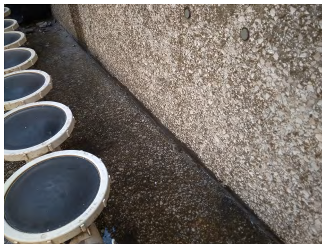
Figura 6. Pérdida de lechada superficial.

Las aguas analizadas presentan un grado de agresividad Qb por ión amonio (48 mg/l) y Qc por CO 2 agresivo (164 mg/l). La concentración de sulfatos es muy reducida (60 mg/l), no agresiva. En las inspecciones realizadas se ha comprobado la existencia de pérdidas de la lechada superficial del hormigón en los paramentos en contacto con el agua residual. (figura 6).